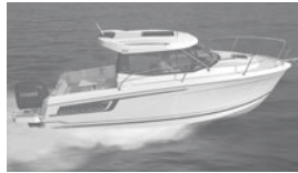
Merry Fisher 695