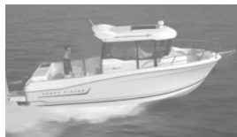
Merry Fisher 695 marlin