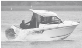
Merry Fisher 605