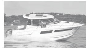
Merry Fisher 855